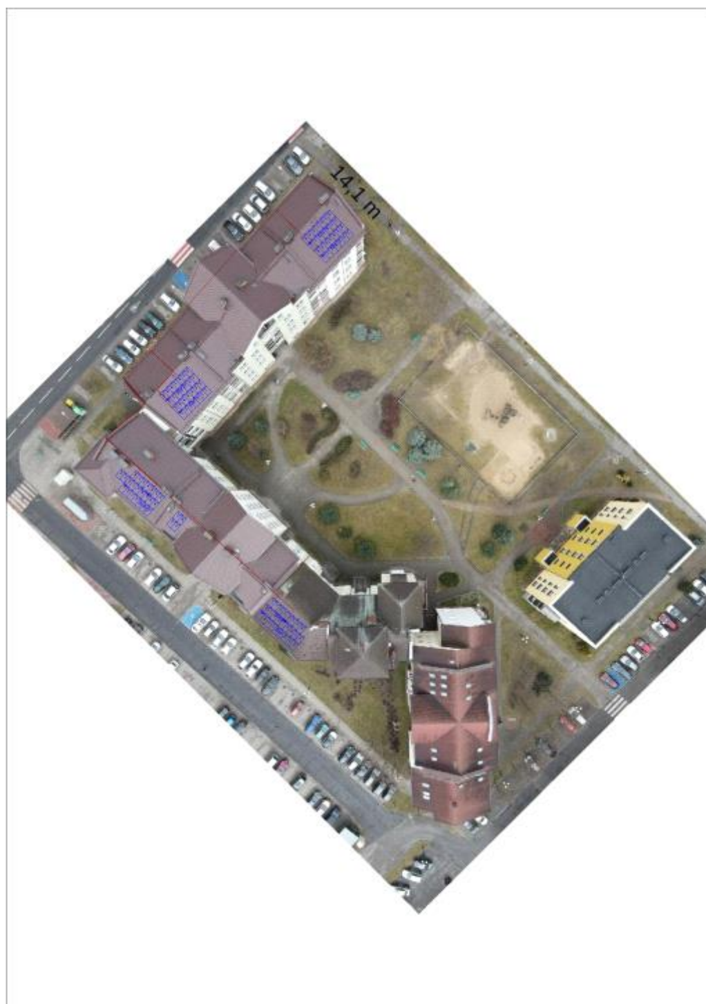
Figura 2: Umieszczenie generatora fotowoltaicznego i grupy konwersji